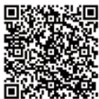
リムジンバス予約 羽田空港行き