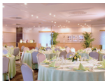
多目的ホール シンフォニー