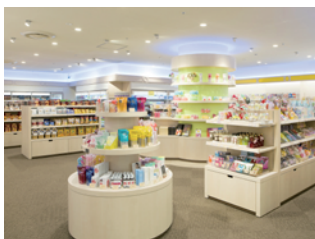
ファーストショップ