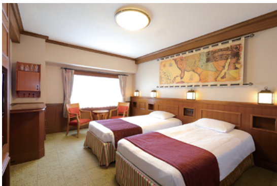
モデレートルーム (ウエスタンスタイル)