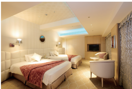
ロイヤルアニバーサリースイート