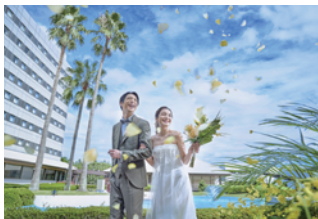
ガーデンセレモニー