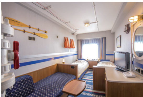
エコノミールーム