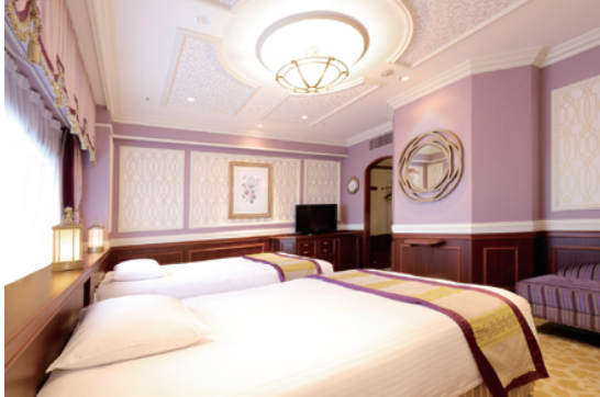
スーペリアルーム (キャッスルスタイル)