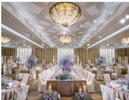
エレガントな雰囲気が魅力の大空間

可憐な花が舞い降りる様子がモチーフの「チャペル トリニティ」 青空のもとでの「ガーデンセレモニー」、由緒正しく伝統的な「神殿」 お二人らしさあふれる華麗な祝宴が叶います