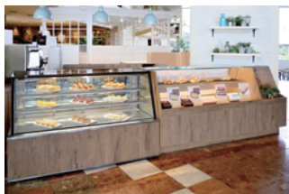
アトリエ カリフォルニア