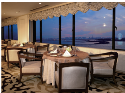
スカイレストラン サンセット

ポピュラーなメニューをはじめ食材や調理法に こだわったフェアメニューをお楽しみになれる 「オールデイダイニング カリフォルニア」 東京ベイの夜景が広がる最上階のフレンチレストラン 「スカイレストラン サンセット」