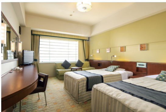
スタンダードルーム