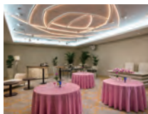
中宴会場 ローズルーム