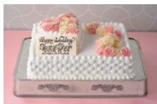
おふたりの希望を形に