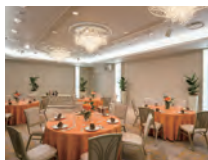
中宴会場 カトリアルーム