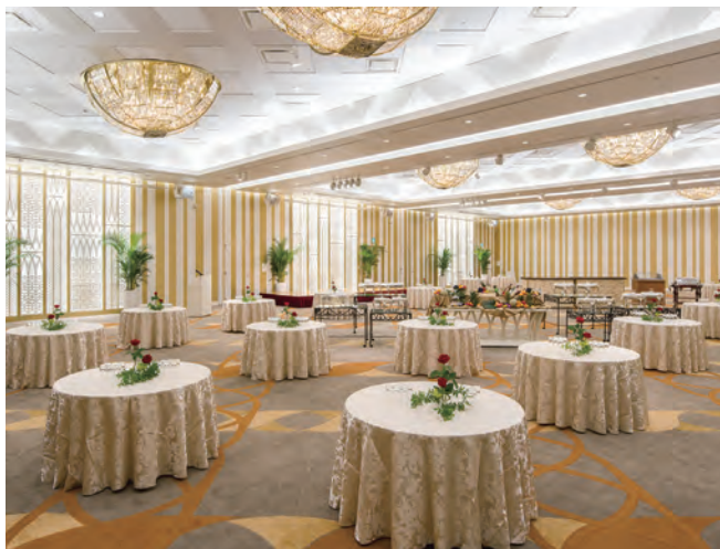
大宴会場 マグノリアホール