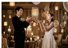
演出も自由自在に