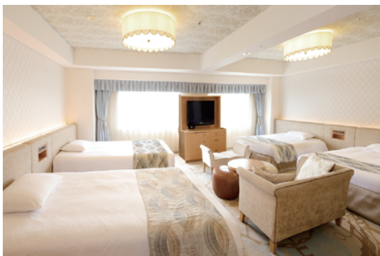
デラックスファミリールーム