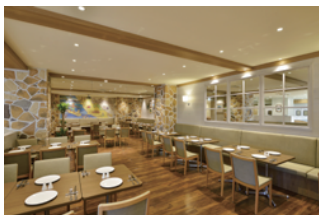
カリフォルニア店内