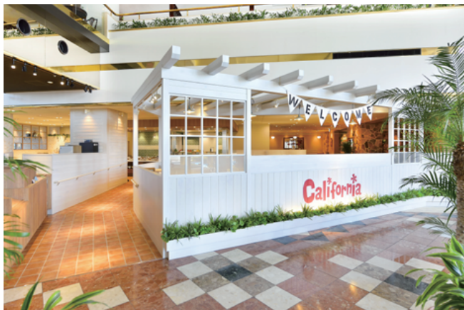
オールデイダイニング カリフォルニア