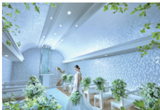
チャペル トリニティ