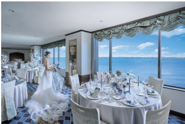
東京ベイが目の前に広がる舞浜随一のロケーション