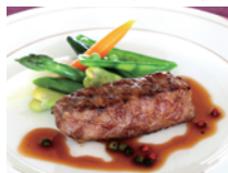
ディナーコースより