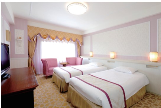
モデレートルーム (キャッスルスタイル)

おとぎ話を連想させるモチーフが魅力的な「お城の中のゲストルーム」 探検心をくすぐるアイテムが散りばめられた「西部開拓時代のアメリカ」 さらにレトロでモダンな雰囲気漂うお部屋など、泊まる楽しみが広がる さまざまなコンセプトルームをご用意しております